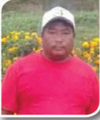
बुधे घले वडा अध्यक्ष, वडा नं.-५