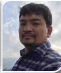
सानो गिरी वडा अध्यक्ष, वडा नं.-७