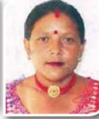
सुन्तली वि.क. वडा सदस्य, वडा नं.-५