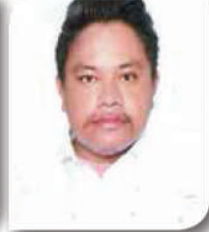
राजुमान माभी वडा सदस्य, वडा नं.-७