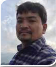
सानो गिरी वडा अध्यक्ष, वडा नं.-७