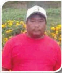
बुधे घले वडा अध्यक्ष, वडा नं.-५